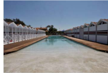
Lido dell'Augustus Hotel & Resort