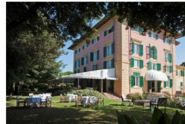
Augustus Hotel & Resort