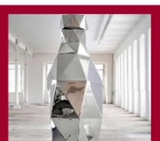
DESIGN Un'opera in mostra FORTE DEI MARMI Incontro fra arte e design Al via le giornate fashion