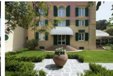
Augustus Hotel & Resort