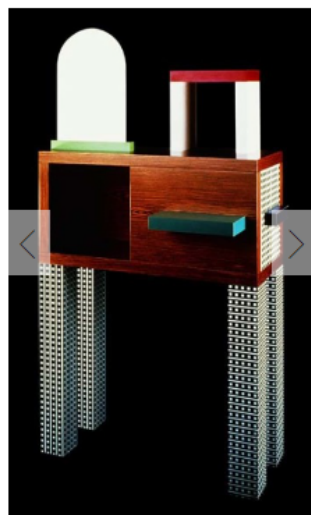
1 - 3 MEMPHIS DESIGN, NATHALIE DU PASQUIER, EMERALD.

La mostra di quest'anno rende omaggio all'imprenditore Giovanni Agnelli, detto Gianni Agnelli, patron della Fiat, da sempre legato alla località turistica toscana.