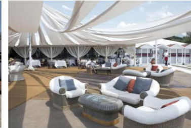
Lido dell'Augustus Hotel & Resort