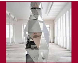
DESIGN Un'opera in mostra FORTE DEI MARMI Incontro fra arte e design Al via le giornate fashion