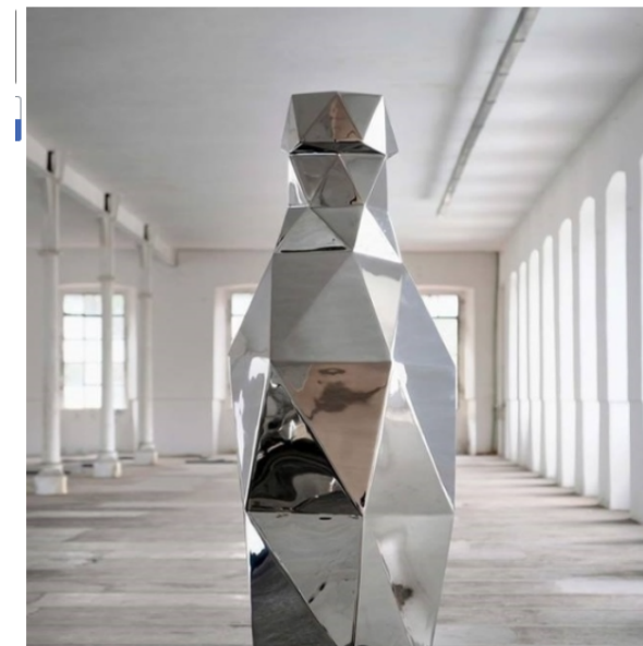
FORTE DEI MARMI